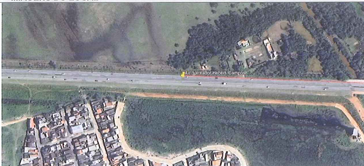
Vista Superior