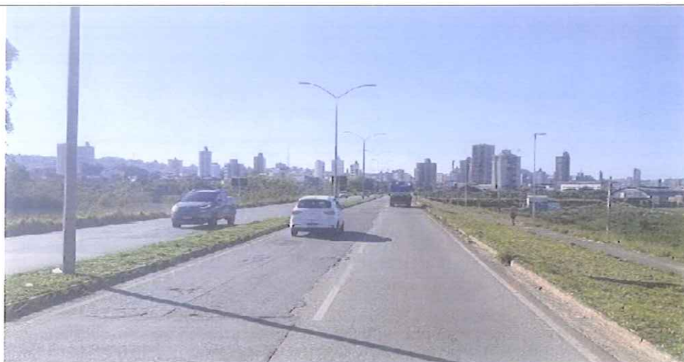
Local Fiscalizado Bairro - Centro