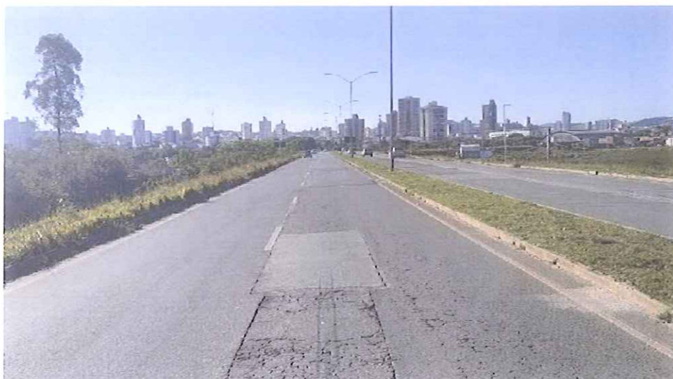
Local Fiscalizado Centro - Bairro